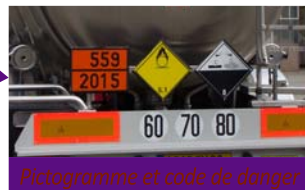
Pictogramme et code de danger