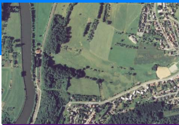
Aiglemont : "Le Moulin"