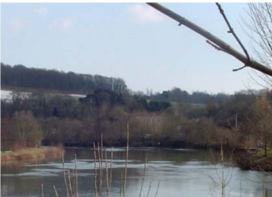
Le Moulin - Aiglemont